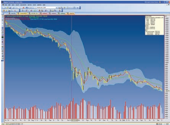
チャート (18 種)

ライン、バー、ローソク足、ローソク出来高、逆ウォッチ曲線、点線、ボックスチャート、面チャート、棒グラフ、鍵足、フォレスト、ポイント&フィギュア、連行足、散布図、ステップ (階段状) ライン、新値足3本足、イールドカーブ、マーケットプロフィール